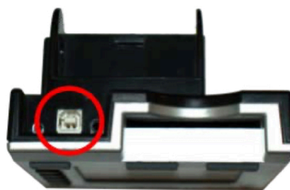
PM3 & PM4

Die benötigten USB A-B 2.0 Kabel werden mit der „B-Seite“ ins Ergometer gesteckt (siehe Abbildung links).